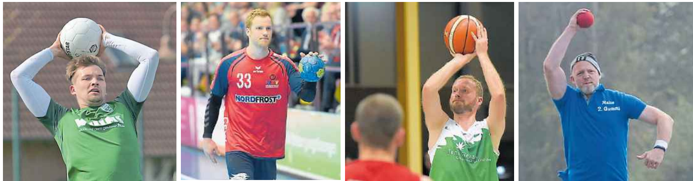
Egal, ob Fußball, Handball, Basketball oder Boßeln, viele Sportvereine nutzen Facebook & Co., um ihre Mitglieder und Anhänger auf dem Laufenden zu halten.