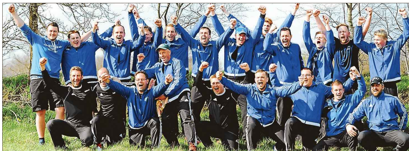
Der Pfalzdorfer Jubel nach dem Titelgewinn kannte keine Grenzen.

BOELEN „Gute Hoffnung“ entscheidet Kopf-an-Kopf-Rennen für sich