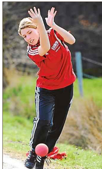
Reitland sicherte sich Bronze.