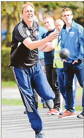
Der oldenburger Meister ging leer aus.