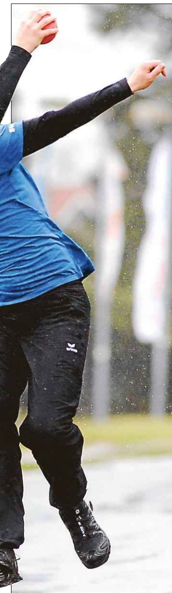
Simone Davids peilt mit Dietrichsfeld am Sonntag den großen Wurf auf FKV-Ebene an.

Ab 16 Uhr erwarten die Fachwarte Boßeln des FKV alle Mannschaften zur Siegerehrung in der Gaststätte Müller in Ardorf. Hier sollen die Sieger und Platzierten der Wettkämpfe im würdigen Rahmen geehrt werden. Die genauen Bedingungen zum FKV-Finale gibt es auf der Homepage des Verbandes. -> @ Mehr Infos unter www.fkv-online.de