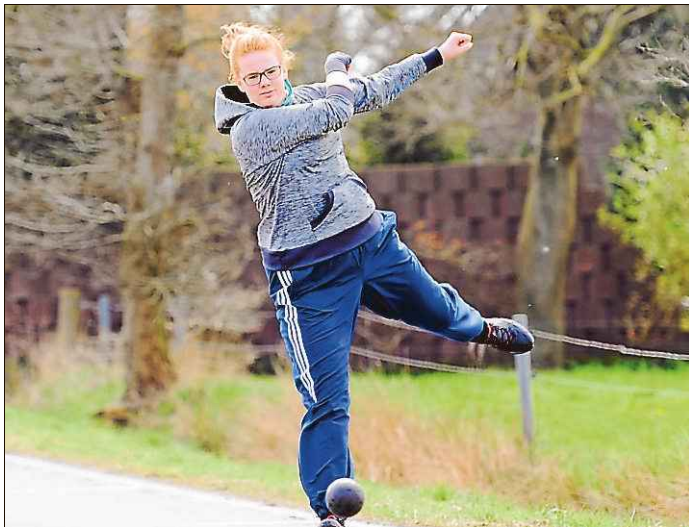
Collrunge/BW erwischte keinen guten Tag. Am Ende wurde das Team Fünfter.