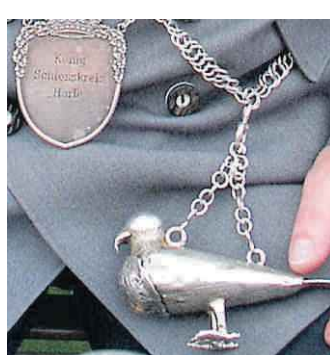
Der Papagoy an der Esenser Königskette.

In der Chronik „100 Jahre KBV „Frisch weg“ Wiesedermeer (1899 – 1999)“ wird darüber berichtet, dass nach einem überlegen gewonnenen Boßelwettkampf gegen den benachbarten Verein „Erika Rispel“ im April 1924 der Sieg in der Gast-