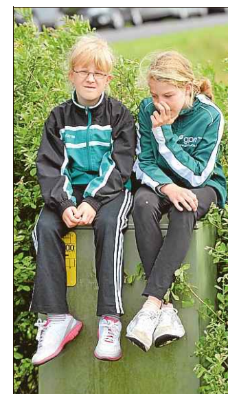
Das Warten zog sich schon mal etwas hin.