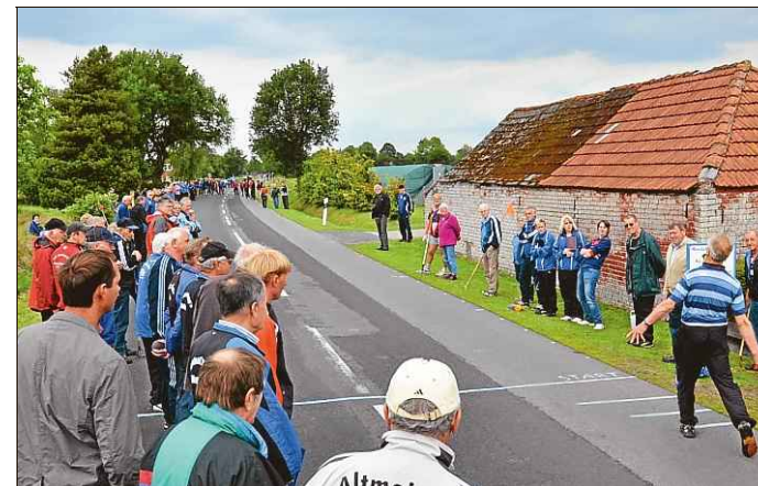
Zahlreiche Käkler und Mäkler säumten den Rand der Wurfstrecke.