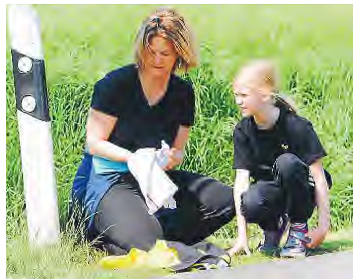
Die letzten Vorbereitungen auf den Wurf. Dabei darf ein Blick auf die Konkurrenz nicht fehlen.