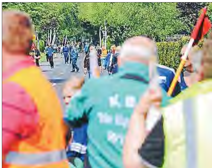
Dichtes Gedränge herrschte rund um Südarle auf den Straßen während der Wettkämpfe.