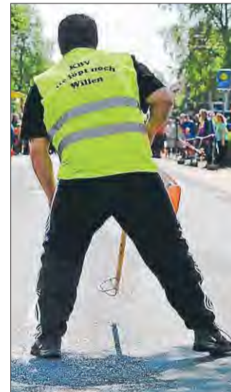
Auch auf die Bahnweiser kam es an.