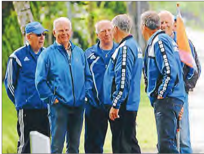
Auch das Fachsimpeln unter den Routiniers kam abseits der Strecke nicht zu kurz.