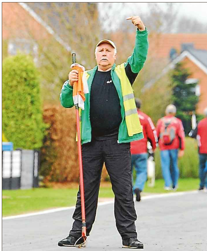
Kleinere Korrekturen am Anlauf können Großes bewirken. Darauf achteten die Bahnweiser.