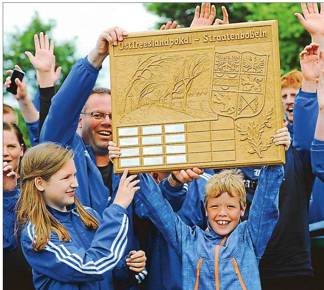
Im Juni jubelten die Pfalzdorfer über den Gewinn des Ostfrieslandpokals. Um erneut ins Finale einzuziehen, muss der Lokalrivale aus Dietrichsfeld bezwungen werden.

Ardorf - Theener: Ardorf musste sich in der ersten Run-