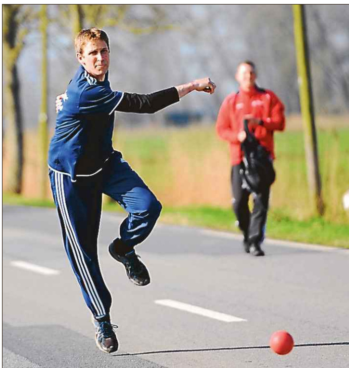
Bei den Männern II erwischte das Team aus Leerhufe nicht den besten Tag.