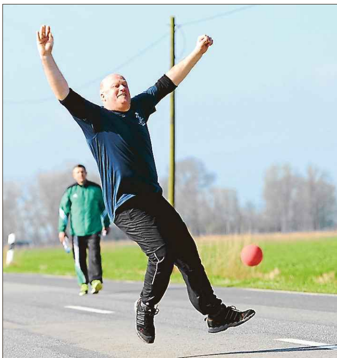
Schwungvoll gingen die Routiniers aus Dietrichsfeld zu Werke.