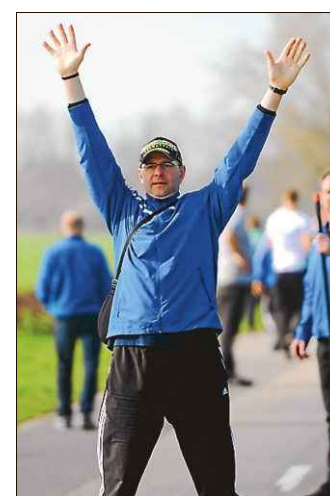
Die Bahnweiser machten sich auf der Straße bemerkbar.

In der Jugend A hatten einige Vereine damit zu kämpfen, überhaupt eine schlagkräftige Mannschaft auf die Straße zu bringen. Vor allem „Noord“ Norden musste sich ordentlich etwas einfallen lassen, um nicht in beiden Jugendklassen durchgereicht zu werden. Der Plan, die A-Jugend mit teils sehr jungen Werferinnen zu besetzen und zumindest in der C-Jugend mit der ersten Besetzung anzutreten, ging dann auch teilweise auf. Rang drei bei den jüngeren Werfern rettete den dritten Platz in der Gesamtwertung.