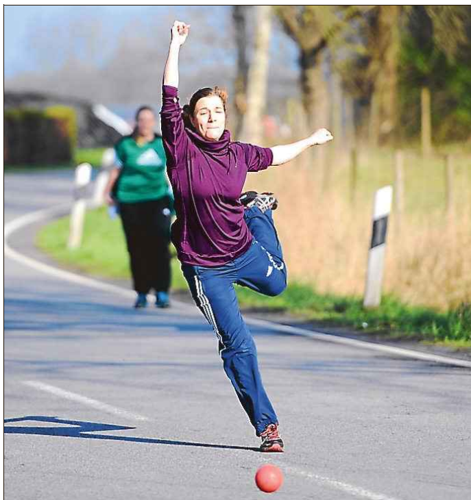
Den Leerhafer Frauen fehlten am Ende gerade einmal 83 Meter bis zum zweiten Platz.