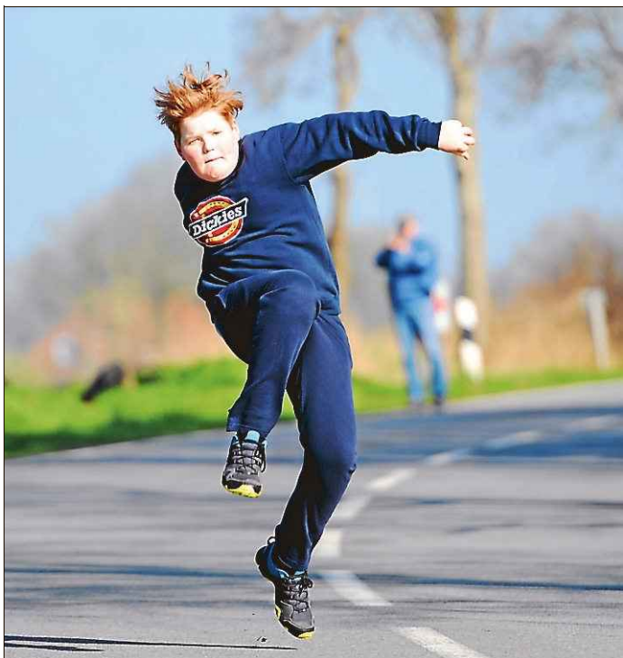
In der C-Jugend hatte Dietrichsfeld mit Problemen zu kämpfen.